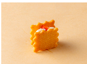
ストロベリーバターサンド