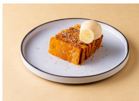
イタリア産チョコレートクリームの ミルフィーユ 塩キャラメルソース バニラアイス