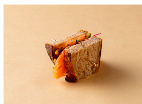
サーモンマリネ & ハーブ サンドウィッチ