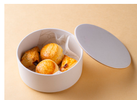
プレーン／メープルとホワイトチョコレート with 山梨県産ラフランスのジャム 塩ホイップバター