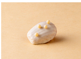
アールグレイの マドレーヌ