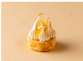
瀬戸内マイヤーレモンの タルトレット