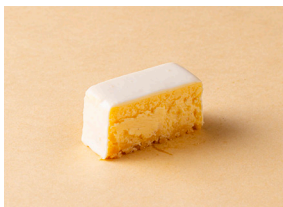
レアチーズケーキ