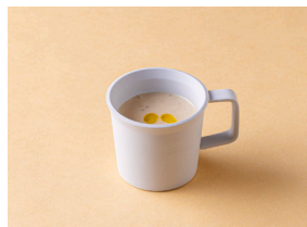
シャンピニオンスープ