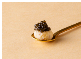
キャビア ゴールド